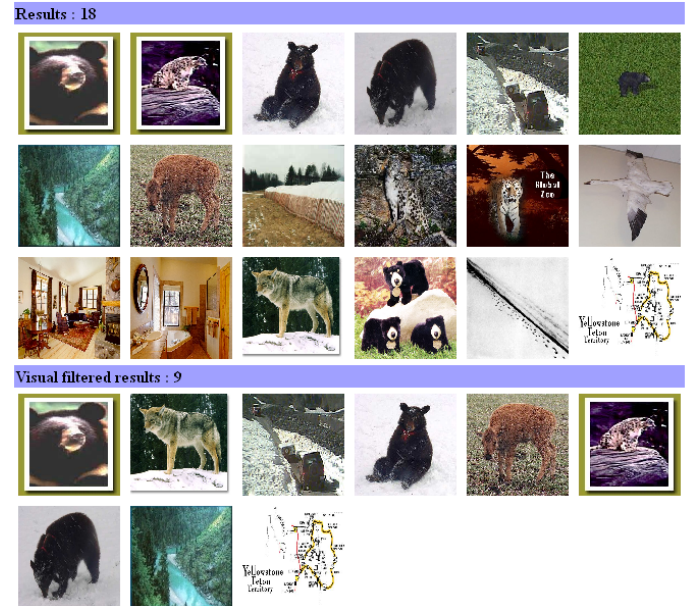
Figure 1. Haut : images résultant de la requête textuelle « Black Bear Snow » sur Google. Bas : images filtrées par notre système visuel.